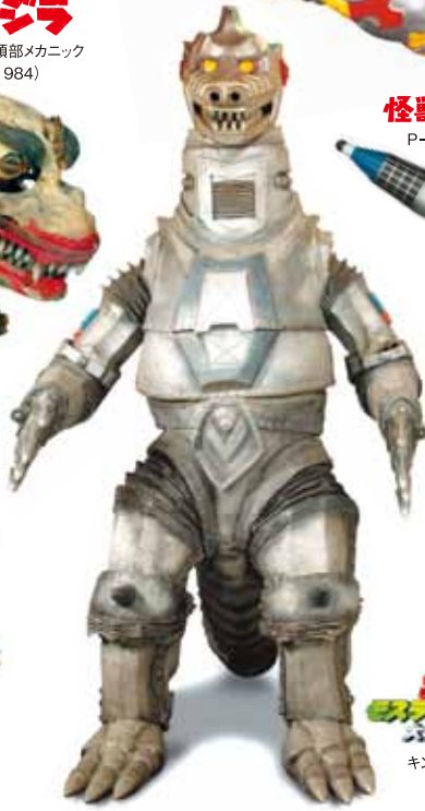
メカゴジラの逆襲 メカゴジラ (1975)