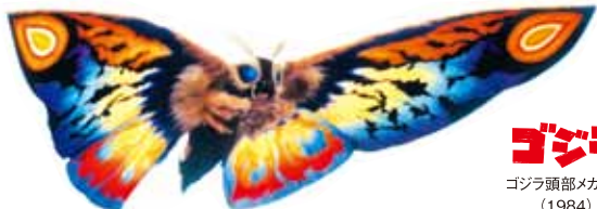
モスラ3 レインボーモスラ (1998)

スクリーンいっぱいにも暴れまわるゴジラ、モスラ、キングギドラ……怪獣と人類の迫力ある闘いは「特撮」と呼ばれる技術で映像化されています。これまで何度も怪獣たちの決戦の舞台となった富士の麓に、日本が世界に誇る怪獣たちが大集合! 1点1点手作りされた怪獣やロボ、細部まで緻密に作り込まれたミニチュアは、いまにも動き出しそうな迫力。貴重な展示品200点超が放つ「特撮のDNA」を、ぜひ間近で感じてください!