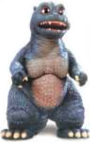
ゴジラ リトルゴジラ (1994)