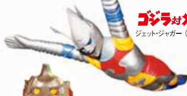
ゴジラ対メガロ ジェットジャガー (1973)