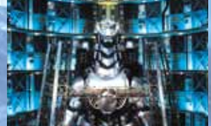
ゴジラ、最大のライバルが襲来!