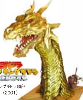
キングギドラ キングギドラ頭部 (2001)