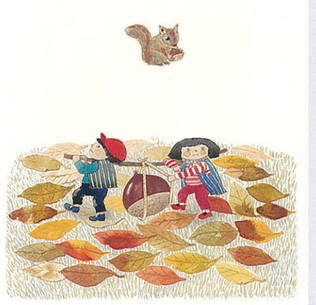
おたより(しぜんのくに 1977年10月)