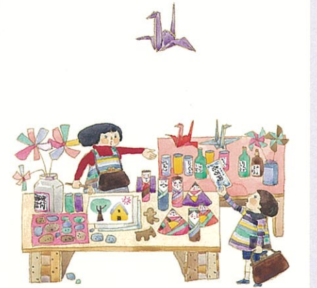
おたより(しぜんのくに 1978年3月)

作品はいずれも津和野町立安野光雅美術館蔵 ©空想工房 テータ提供「津和野町立安野光雅美術館」